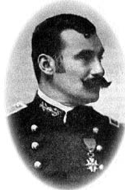
El entonces capitán de fragata García Mansilla, luciendo la Legión de Honor.

Fueron también muchos cientos -si no millares- los salvamentos unipersonales, es decir, los rescates de un tripulante caído a las aguas, de un enfermo transportado por embarcaciones menores hacia otro buque o a tierra, al carecer el de su destino de asistencia médica. Para cerrar este trabajo citaré a cuatro de ellos, con distintos finales y más que variados reconocimientos.