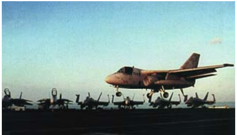
Un S-3B Viking regresando de un RECOVU.