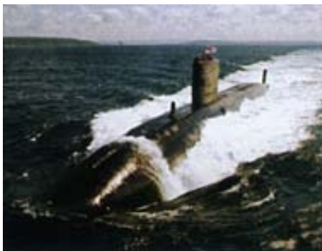
Submarino británico HMS Trafalgar .