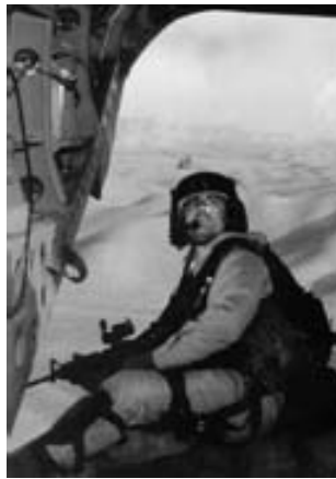
Fuerzas Especiales del USA a bordo de un Chinook.

Entre el 25 y 26 de noviembre se desarrolló un duro enfrentamiento en la fortaleza (del siglo XIX) Qala-I-Jangi, situada a 6 MN de Mazar-e Sharif, cuando se rebelaron unos 500 talibanes prisioneros que mataron a un agente de la CIA. A pesar de los esfuerzos de la tropas de la Alianza del Norte, apoyada por sus tanques y fuerzas especiales de los EE.UU., la prisión sólo pudo ser reconquistada después de los ataques con aviones embarcados y aviones cañoneros AC-130U de la USAF.