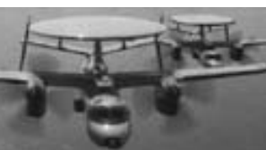
Aviones DAT E-2 Hawkeye.