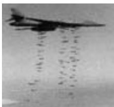
Bombardero estratégico B-1B Lancer.