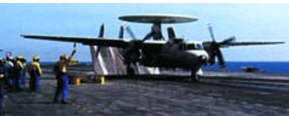
E-2 Hawkeye de la USN operando a bordo del Charles de Gaulle .