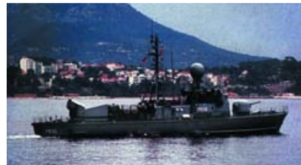
Una de las lanchas rápidas de la Armada de Alemania destacada a las costas de Somalia.