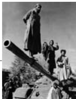
Talibanes sobre un tanque en Kabul.