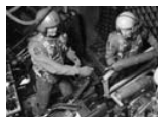
AC-130U Spooky de la USAF.