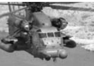
MH-53J "Pave Low" de las Fuerzas Especiales del USA y la USAF.