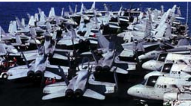
Aviones F-18 y S-3B a bordo de un portaaviones de la USN.