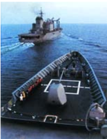
El buque de Sostén Logístico japonés Hamana , próximo a reabastecer al USS Antetiam .