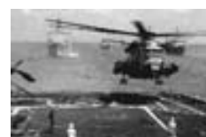
CH-53E Sea Stallion.