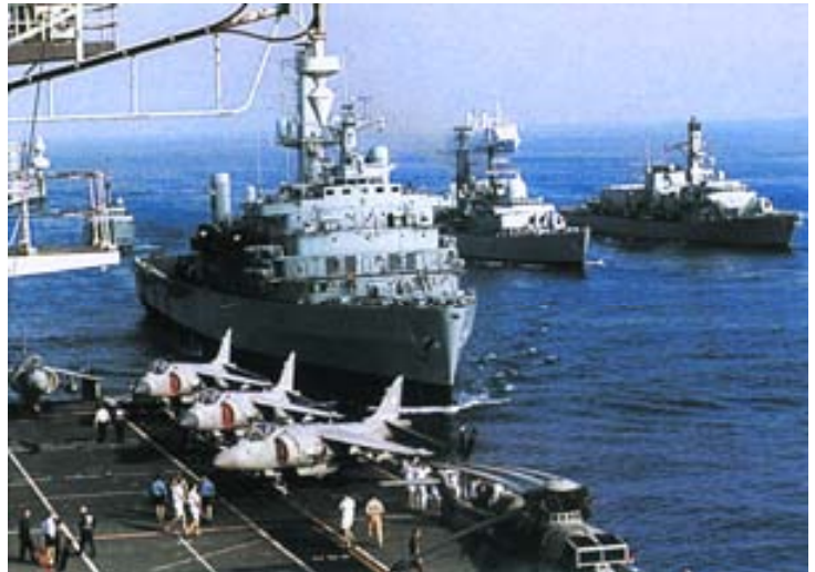
Buques de la Fuerza de Tareas británica próximos a Omán.