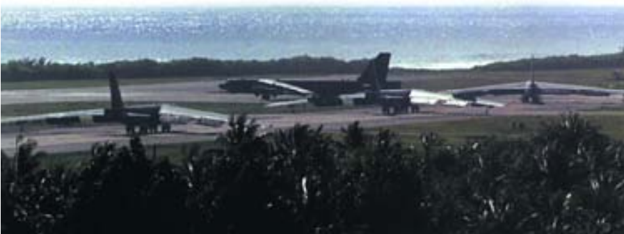
Bombarderos estratégicos B-52 en la base de Diego García.