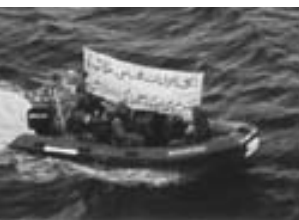
Equipo de abordaje italiano haciéndose entender por medio de una pancarta.

probarse que esas armas tenían como destino al gobierno de Yemen, se permitió al carguero que siguiera su ruta.