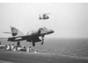
SuperEtandard sobre el portaaviones Clemenceau , gemelo del Sao Paulo de la Marina de Brasil.

Ha habido propuestas a la Armada argentina para modernizar los nuestros con estos estándares.