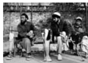
Afganos lisiados en guerras anteriores.

(5) La población de Afganistán era de casi 27 millones.