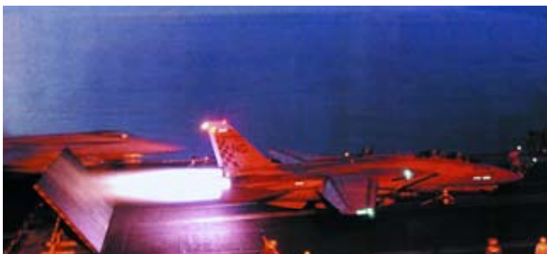
Catapultaje nocturno de un caza F-14 Tomcat.