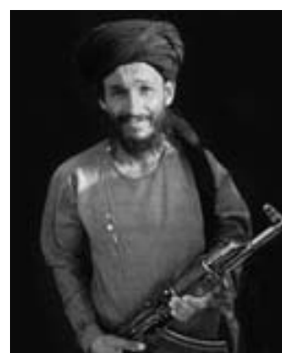
Guerrero Pasthune talibán con fusil AK-47.

(5) La población de Afganistán era de casi 27 millones.