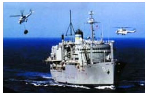
Buque de sostén logístico Etna , de la Marina italiana, aprestándose a reabastecer al portaaviones Charles de Gaulle .