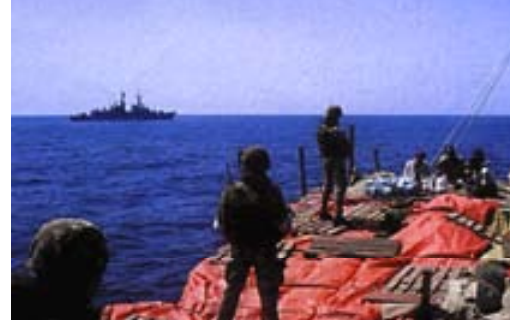
Operaciones de abordaje y registro de la Marina italiana.