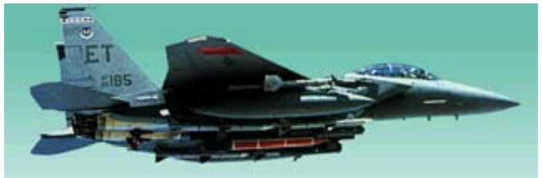
Cazabombardero F-15E Eagle de la USAF con una bomba GBU-28 en la estación central.