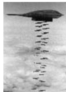
Bombardero estratégico B-2 Spirit de la USAF.

Es importante destacar que si bien Pakistán fue la única nación limítrofe que concedió desde un primer momento el uso de corredores aéreos útiles para los ataques de la coalición,