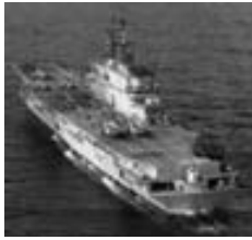
Portaaviones Giuseppe Garibaldi .

tinenciales (sólo el primer día) y desde la isla Diego García en el Océano Índico, mientras que los aviones tácticos volaron desde algunas de las naciones árabes mencionadas.