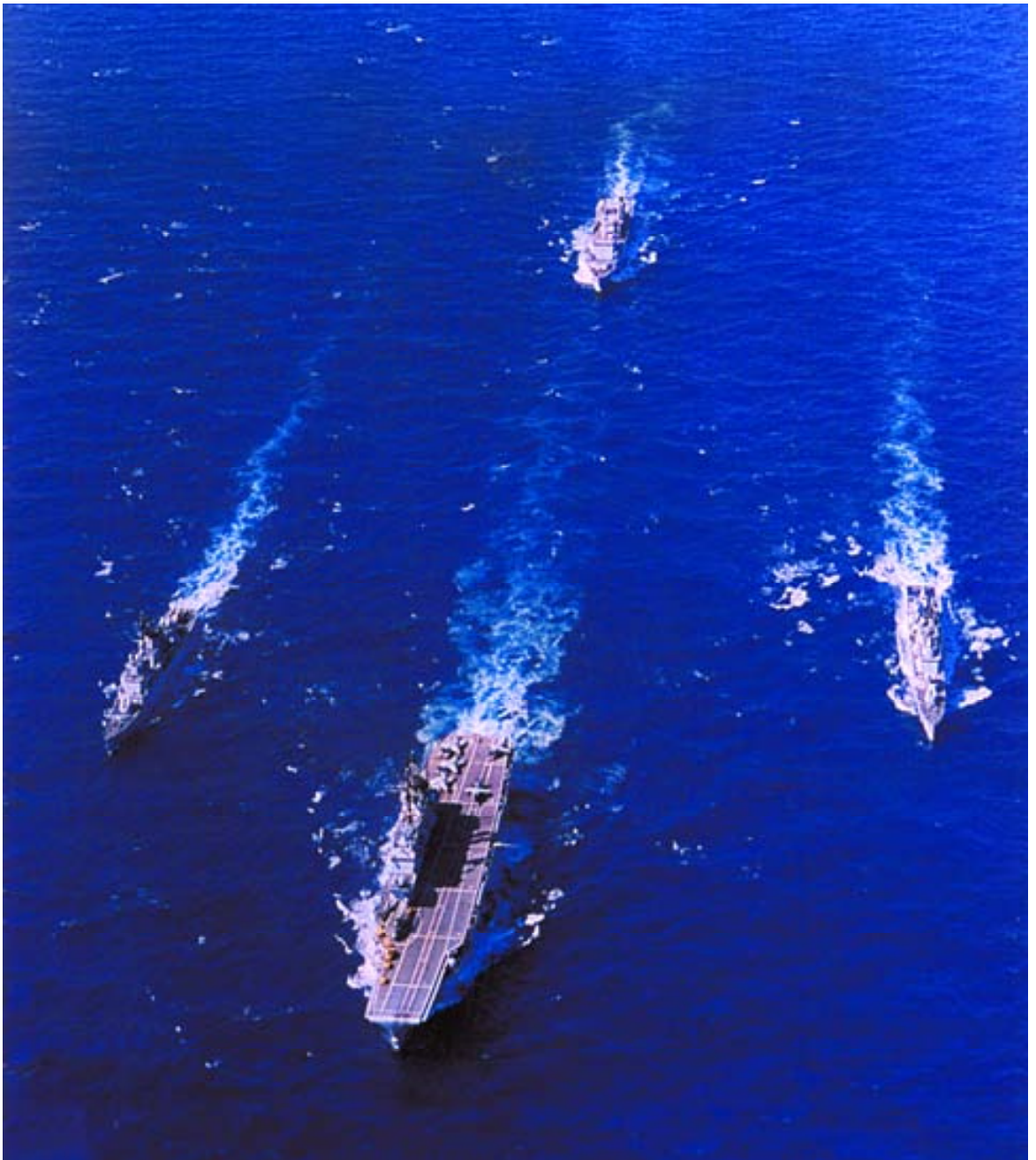
Portaaviones Giuseppe Garibaldi , fragata Zeffiro , corbeta Aviere y buque de sostén logístico Etna .