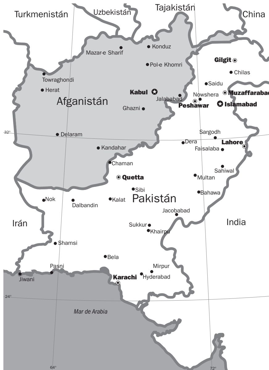
A la derecha, Afganistán, Pakistán y naciones limítrofes.