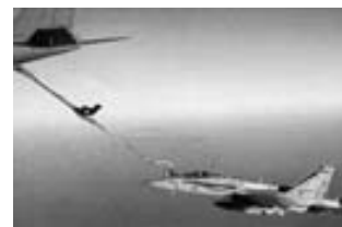
F-18 de la USN reabasteciéndose de un KC-135 de la USAF.

Los mayoría de los aviones de inteligencia, reconocimiento y vigilancia de la coalición, así como los aviones cisterna, de transporte intrateatro y de otros tipos, operaron desde bases en Arabia Saudita, Qatar, Kuwait, Emiratos Arabes Unidos y Omán y, como queda dicho, los bombarderos estratégicos de la USAF lo hicieron desde bases en los EE.UU. con-