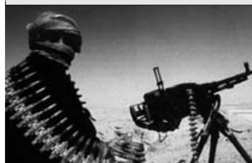
Voluntario árabe de las fuerzas talibanes, con ametralladora rusa de 14,5 mm.

NOTA: Buena parte del material aéreo y terrestre detallado era obsoleto o estaba fuera de servicio (50% de las aeronaves).