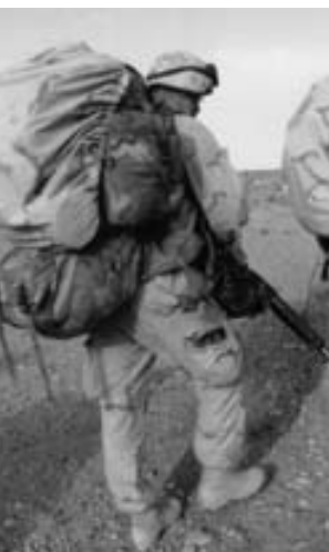
Infante de marina operando desde Camp Rhino.