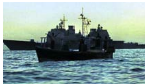
El crucero USS Antetiam auxiliando a una embarcación en emergencia.