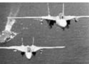
Cazas F-14 Tomcat.

Coherentes con la política de evitar pérdidas propias —y a menos que resulte necesario u oportuno hacerlo antes— se espera contar con la Supremacía Aérea para recién iniciar los ataques aéreos a los blancos seleccionados, los que una vez batidos con los efectos buscados, permitirán la prosecución efectiva y segura de las restantes operaciones aéreas y de las operaciones terrestres. Ello, sin descuidar la escolta aérea de los aviones que realizan esos ataques y las misiones de supresión de defensas antiaéreas enemigas