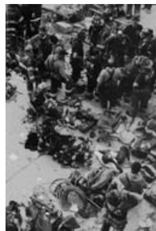
Bomberos y policías de New York en una pausa de sus tareas de rescate.

Pero las Naciones Unidas continuaron reconociendo a Rabbani como el gobernante legal, y en 1999 impusieron un embargo aéreo y económico al régimen Talibán, por proveer un santuario a las actividades del grupo terrorista Al Qaeda y a su jefe Osama bin Laden.