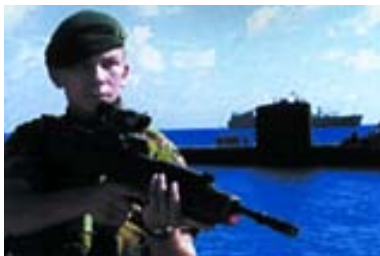
Royal Marine de guardia en Diego García. Al fondo, un submarino británico.