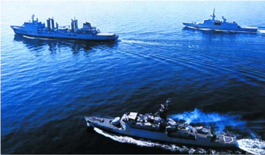
Buques franceses del Grupo de Tareas del Charles de Gaulle .