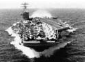
(11) La distancia entre el extremo nordeste de la península arábiga y el punto de la costa del Mar de Arabia, donde se encuentra la frontera entre Irán y Pakistán, es de aproximadamente 700 MN. La distancia entre ese punto y la frontera con Afganistán es del orden de 270 MN. Afganistán tiene una forma casi elíptica, con una longitud máxima en la dirección suroeste a nordeste de 790 MN y una anchura de 390 MN.

no permitió que se usaran con ese propósito las bases en su territorio, autorizando su empleo sólo para escalas técnicas, misiones logísticas, de búsqueda y rescate, humanitarias y también, aunque en su momento se le ocultó a la prensa, para insertar y apoyar a fuerzas especiales. Las restricciones para lanzar ataques aéreos desde su territorio recién fueron quitadas —y con limitaciones— una vez establecido el nuevo gobierno en Afganistán.