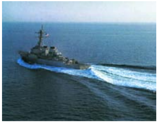
Destructor USS Curtis Wilbur .