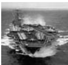
Portaaviones Carl Vinson .

Los primeros aviones de caza y ataque que llegaron sobre Afganistán el 7 de octubre de 2001, alrededor de las 2230 hora local, fueron 25 F-14 y F18 que partieron de los portaaviones Enterprise y Carl Vinson —dirigidos por los aviones E-2C de esos buques— y junto con ellos llegaron los ataques de 21 bombarderos estratégicos de la USAF B-1B Lancer, B-2 Spirit y B-52H Stratofortress. Todos esos aviones fueron acompañados por aviones F-14 y EA-6B de los portaaviones que, respectivamente, proveyeron escolta aérea y la interferencia de los radares enemigos. Los aviones embarcados fueron reabastecidos de combustible en sus piernas de ida y regreso, por 7 birreactores multimisión S-3B de las escuadrillas de control marítimo de los buques nombrados.