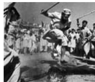
Pasthunes de Pakistán quemando una efigie de un líder occidental.

(10) El USMC es una cuarta fuerza separada que, junto con la USN, depende del Secretario de Marina.