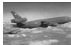
AV-8B Sea Harrier II Plus de la Marina Italiana reabasteciéndose de un avión cisterna de la RAF.