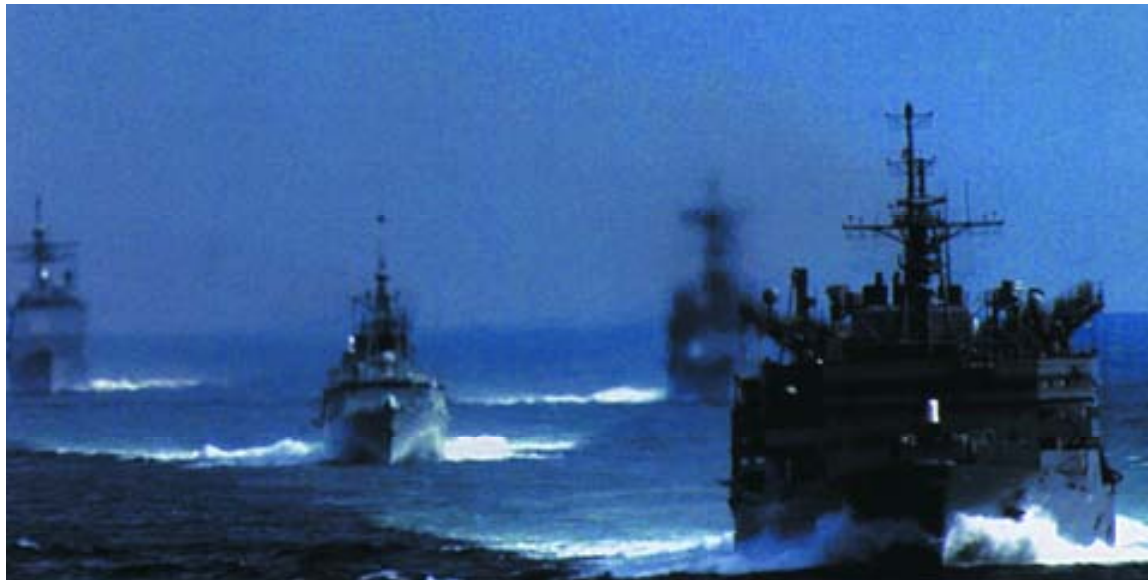
Buques del Grupo de Batalla del portaaviones USS John C. Stennis . Segunda desde la izquierda, la fragata de la Armada de Canadá HMCS Vancouver .