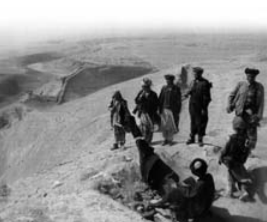
Guerreros de la Alianza del Norte.

Llegados a este punto, es necesario destacar que los talibanes contaban, al menos inicialmente, con la simpatía de la mayoría de la población que habita el sur y el este del país, de etnia pasthuna y religión musulmana sunnita, y que tiene lazos estrechos con los habitantes del norte de Paquistán, nación esta que entre sus vecinos era la única que reconocía la legitimidad del gobierno Talibán.