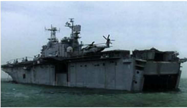
Buque de asalto anfibio USS Peleliu .