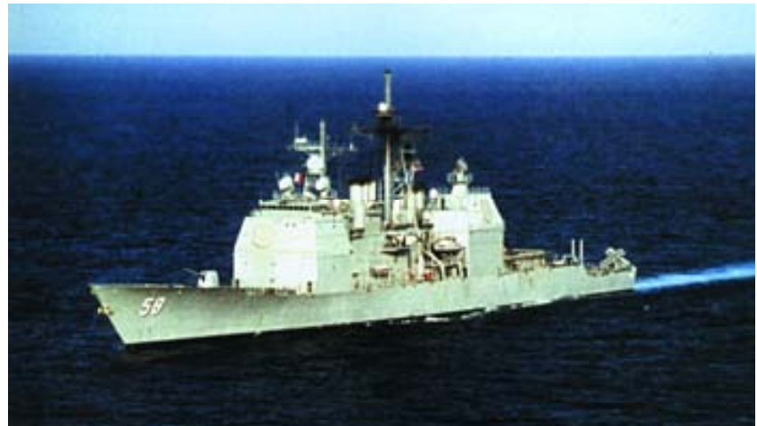
Crucero USS Philippine Sea .