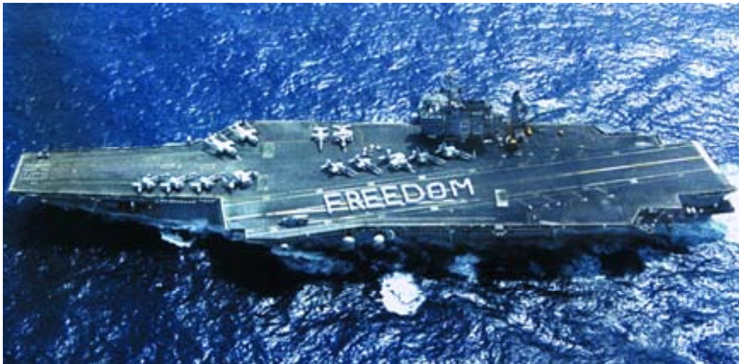
Portaaviones USS Kitty Hawk .