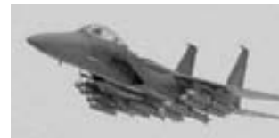
Cazabombardero F-15 Eagle de la USAF.

En la noche del 25 al 26 de noviembre se conquistó, y luego estableció, la primera base adelantada en Afganistán, desde donde se pudo operar con aviones de ataque AV-8B Harrier II y helicópteros del USMC. La conquista de esta precaria pista, situada en el desierto 100 kilómetros al sudoeste de Qandahar, fue hecha por una fuerza de infantería de marina, que llegó a bordo de helicópteros CH-53E Sea Stallion, lanzados desde buques anfíbios, y aviones KC-130 Hércules pertenecientes también a esa fuerza. Esta misión tuvo